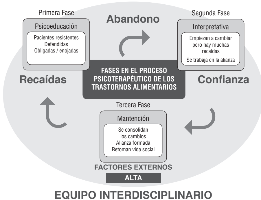
Figura 1. Fases del proceso psicoterapéutico de los trastornos alimentarios.

las terapeutas atribuyen a las pacientes se encuentran: el apoyo de la familia, la motivación al tratamiento, la conciencia de enfermedad y la confianza en el equipo.