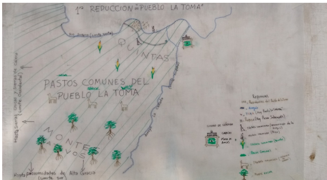
Figura N° 2: Cartografía colectiva del período uno: “Primera reducción del Pueblo de La Toma”

Fuente: Foto del autor – Setiembre de 2017