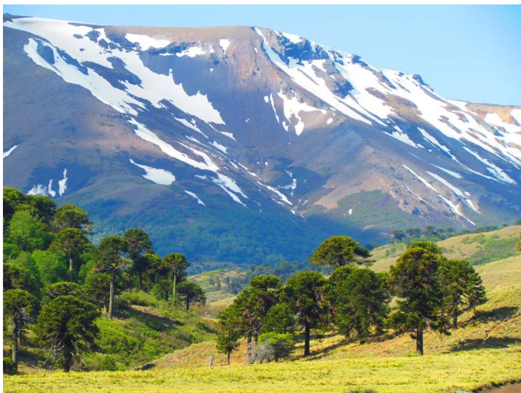
Figura 3 Pinalerías o bosques de Araucaria.

“Se piñonea en la pampa Cayulafquén, es una pampa, una meseta en donde salen muchos piñones, eso es algo que no se ha perdido, que después lleguen todos en común y se recojan los piñones en las veranadas, ahí están todos igual unidos. Pero casi todos tienen, ya, cada uno sabe hasta dónde llega su campo ¿cierto?. Y ahí piñonean...y hay algunos que no tienen pinos. Entonces ese es el problema, todavía hay una consideración que de repente, que el que tiene pino al que no tiene pino, le convida al vecino”.