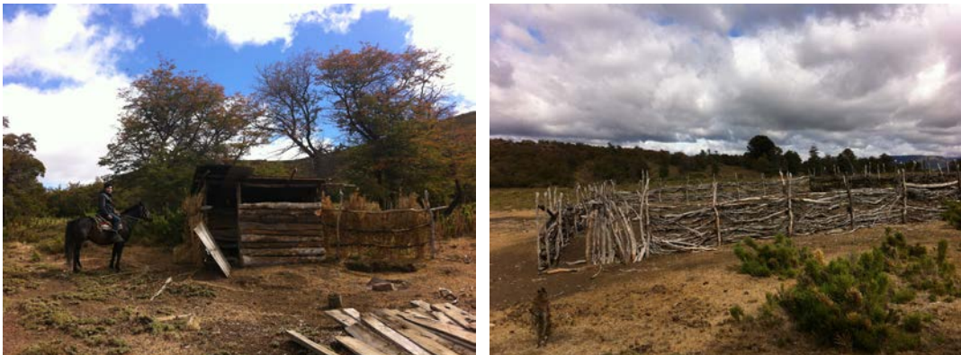
Figura 1 Puesto de veraneo y corral para animales.

El resto de los miembros de la comunidad lo hace entre diciembre y enero. Lo anterior se debe a que los puestos más alejados se encuentran a mayor altura (entre los 1300 a 1700 msnm) y que, en condiciones climáticas normales, la nieve no permite establecerse en los puntos de pastoreo tempranamente. El período de veraneo dura entre 4 a 6 meses. El inicio de la invernada en Pehuenco está marcada por las primeras heladas del año, por lo tanto, este es un indicador para el inicio del arreo de animales hacia las partes bajas del valle, lo que ocurre entre fines de marzo y mayo.