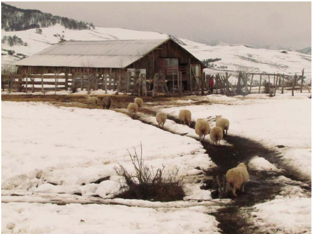
Figura 2 Animales menores en la invernada.

un total de 60 (Figura 2). Sin embargo, no es posible establecer un número exacto de animales; según estadísticas del Servicio Agrícola y Ganadero (SAG), el total de animales rondaría las 2000 cabezas en este año. En cuanto al tiempo que tarda el trayecto hasta los lugares de pastoreo, desde el inicio de la veranada hasta los puntos más lejanos en Laguna Escondida y Piedra Sinchona alcanzan los 23 y 25 kilómetros respectivamente, para lo cual los animales grandes pueden demorar un día de ruta y los animales pequeños dos días.