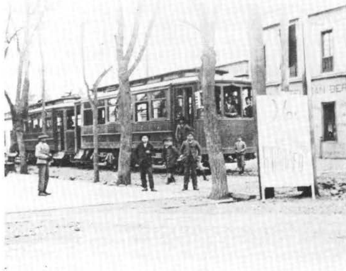
Plaza de San Bernardo. Fotografía atribuida a Juan M. Sepúlveda, hacia 1910.

Aún así, nos parece de importancia el reconocimiento de esta realidad, pues ellos son parte del modo de construir el lenguaje y el conjunto de símbolos acerca de la recepción del Teatro en nuestros países. Son, por lo tanto, representativos e influyentes en el desarrollo de nuestra cultura teatral. □