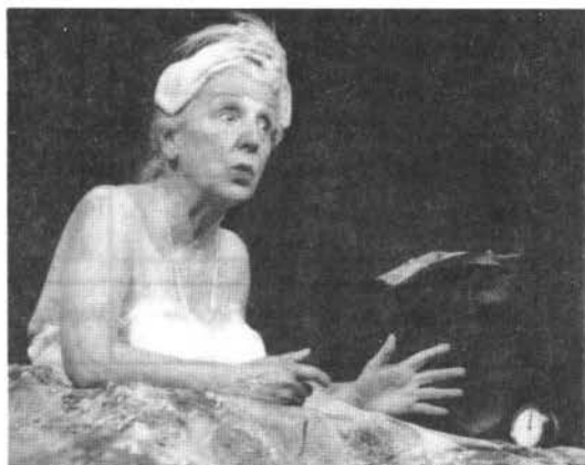
"Los Días Felices"