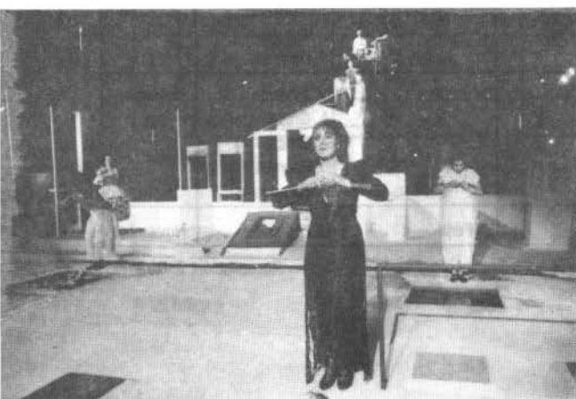
"Viva la República"