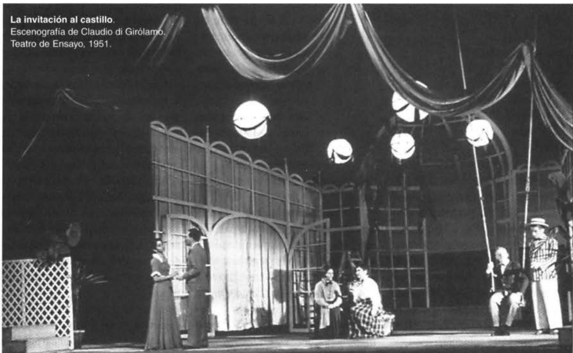
La invitación al castillo. Escenografía de Claudio di Girólamo. Teatro de Ensayo, 1951.

No enciendo las luces. Bajo a tientas la escalera, como un ciego, encandilado aún por la luz del sol que inun-