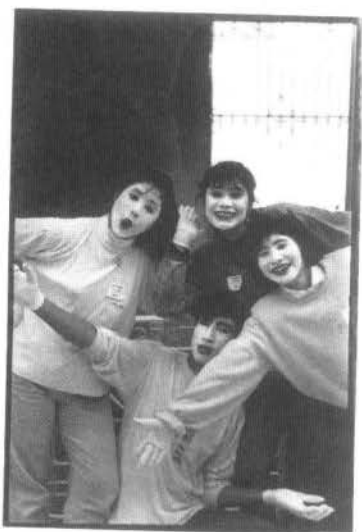
Grupo de la 1ª Región. Seminario de perfeccionamiento para grupos de teatro regionales. División de Cultura Mineduc, 2001.