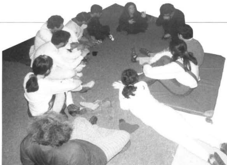
Grupo de la 1ª Región. Seminario de perfeccionamiento para grupos de teatro regionales. División de Cultura Mineduc. Iquique, 2002.

uno de los momentos más duros que he vivenciado en los 43 años que tengo, pero que afortunadamente, pude sobrellevar y superar con dignidad.