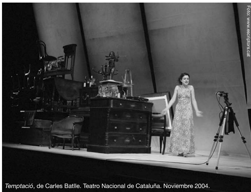
Temptació , de Carles Batlle. Teatro Nacional de Cataluña. Noviembre 2004.

organizador externo, evidencia el carácter ficcional/representacional y provoca –siguiendo la terminología brechtiana– el “distanciamiento” del receptor (“lo discontinuo impuesto por el cuadro detiene la acción y nos obliga a reflexionar al no permitir que nos arrastre el curso del relato”). 3