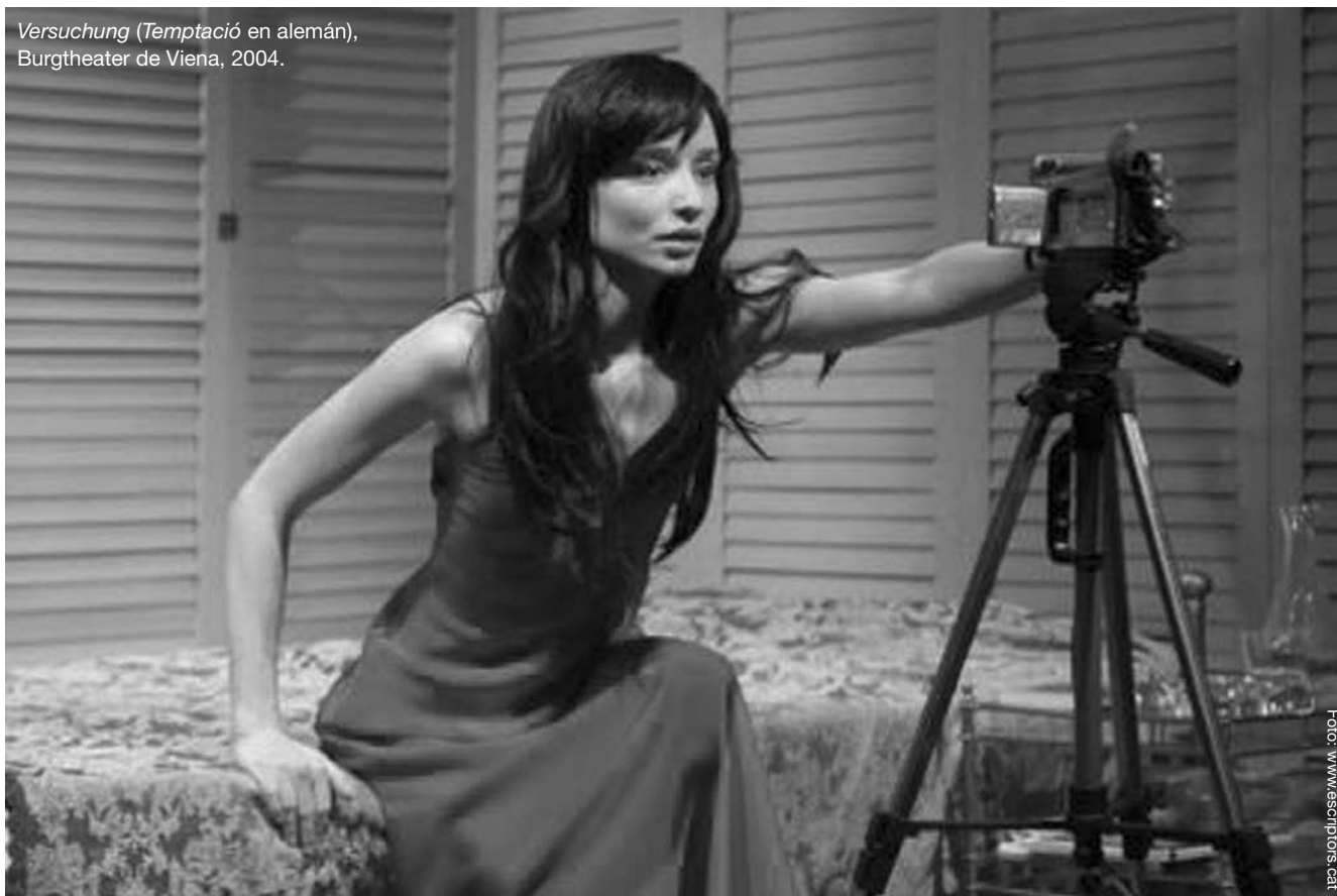
Versuchung (Temptació en alemán), Burgtheater de Viena, 2004.