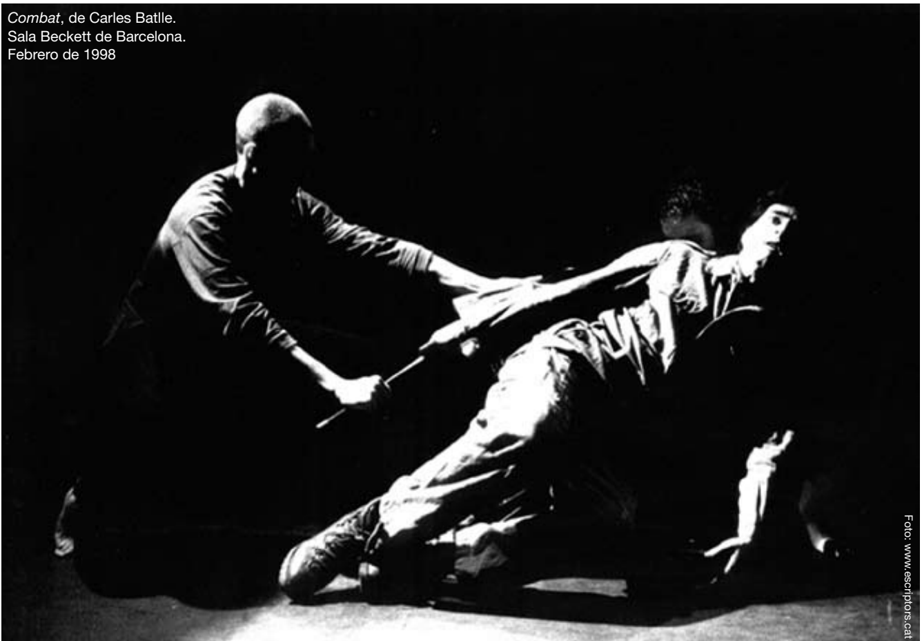
Combat , de Carles Batlle. Sala Beckett de Barcelona. Febrero de 1998

a) En primer lugar, debemos tener claro que segmentar –como dice Pavis– “no es una actividad teórica perversa e inútil que destruye la impresión de conjunto; por el contrario, es tomar conciencia del modo de fabricación de la obra y apropiarse de su sentido, preocupándose por partir de la