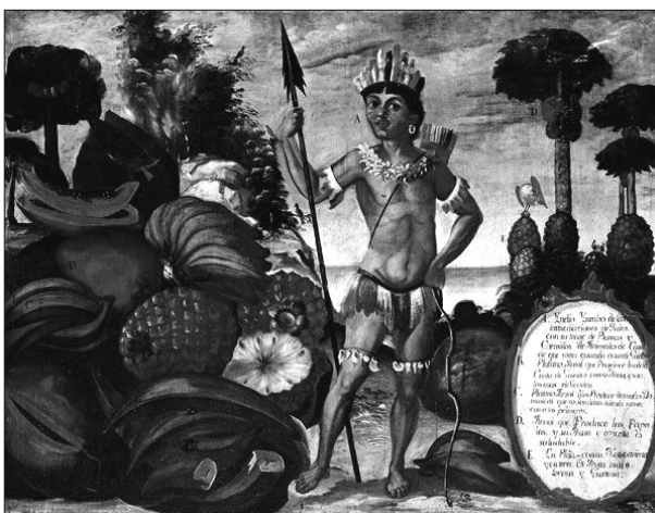
Fig. 4. Vicente Albán: Indio yumbo de las inmediaciones de Quito, 1783, óleo sobre lienzo, 80 x 109 cm.

¿Cómo se verificó el proceso de constitución de la escena de género? Esta compleja pregunta ha encontrado generalmente respuesta considerando la notable ampliación de mercado que experimentaron los países protestantes, es decir, la constitución de un mercado burgués que aspira legitimarse y reconocerse en un cierto tipo de pintura. La naturaleza «laboral» de la burguesía encontró caracterización en la representación más