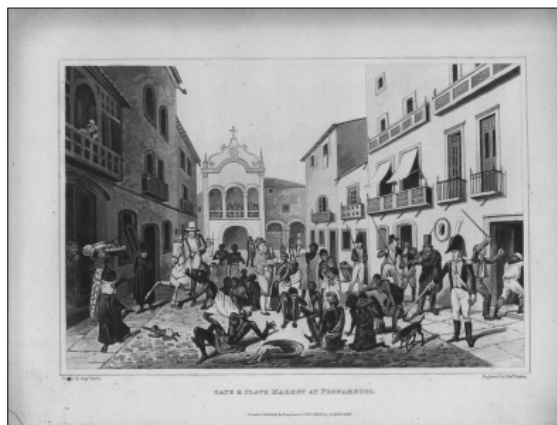
Fig. 1. María Graham: Vía y mercado de esclavos en Pernambuco. Journal of a Voyage to Brazil , 1824.

En el conjunto de acuerdos que establecimos anteriormente, salta a la vista algo que, si bien está implícito en todas las imágenes y narraciones de que disponemos sobre el periodo que nos ocupa, no lo hacía de la manera tan evidente como lo ha hecho aquí: el libro, cuyos modos corporales de recepción claramente difieren del tipo de contemplación que reclama la pintura en sentido tradicional. En efecto, ello es claramente perceptible en el tipo de imágenes producidas por los artistas viajeros del primer tercio del siglo XIX que no pertenecían a las expediciones científicas: la disposición de la imagen y la posición del horizonte en la superficie pictórica es resuelta, con relativa probabilidad, considerando el hecho de que dichas imágenes habrían de circular principalmente bajo la forma de un cartapacio de viajes (Figuras 1 y 2).