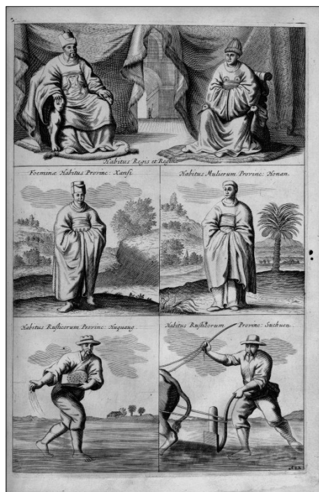
Fig. 8. Atanasio Kircher: Campesinos. China Monumentis , 1667, Cortesía del Instituto Max Planck, Berlín.

De la misma manera, el crecimiento de las artes útiles y la demanda epocal por decorar dichos objetos con escenas de costumbres no sólo había acompañado a esas publicaciones, sino que también permitieron la circulación de estas imágenes colaborando en el proceso de su conversión en temas de encuadre, como denomina Bialostocki (1974: 111-24) al proceso según el cual un repertorio iconográfico organizado, en torno a temas de carácter arquetípico, se constituye en referente obligatorio del campo semántico que les subyace, a pesar de los giros epocales. En nuestro caso, la proposición de Bialostocki está siendo conducida al aspecto semántico-compositivo del género pintura de costumbres.