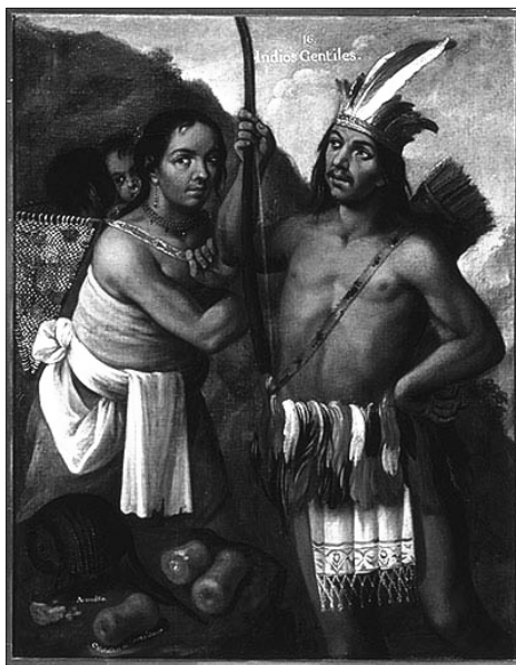
Fig. 3. Miguel Cabrera: Yndios Gentiles, 1763, óleo sobre lienzo, 132 x 103 cm.