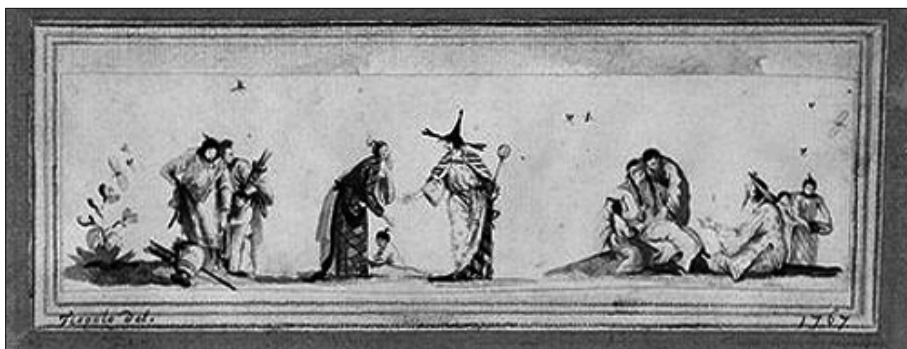
Fig. 5. Giovanni Battista Tiepolo (atr.): Chinoiserie, 1767, grafito, acuarela, tinta negra y blanca sobre papel montado sobre papel, 5,1 x 18,4 cm.

discurso enrarecido, como también se sabe, por la naciente concepción romántica de «pueblo». En efecto, mientras la escena pintoresca buscaba retratar al pueblo desde una perspectiva más bien bucólica, eventualmente ligada al capricho, la pintura galante privilegió otro sistema compositivo, en el que la función moralizante se verificaba por la vía del voyeurismo. 4