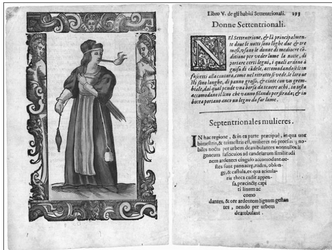
Fig. 6. Cesare Vecellio: Mujer del Septentrión. Habiti Antichi et Moderni , 1559.