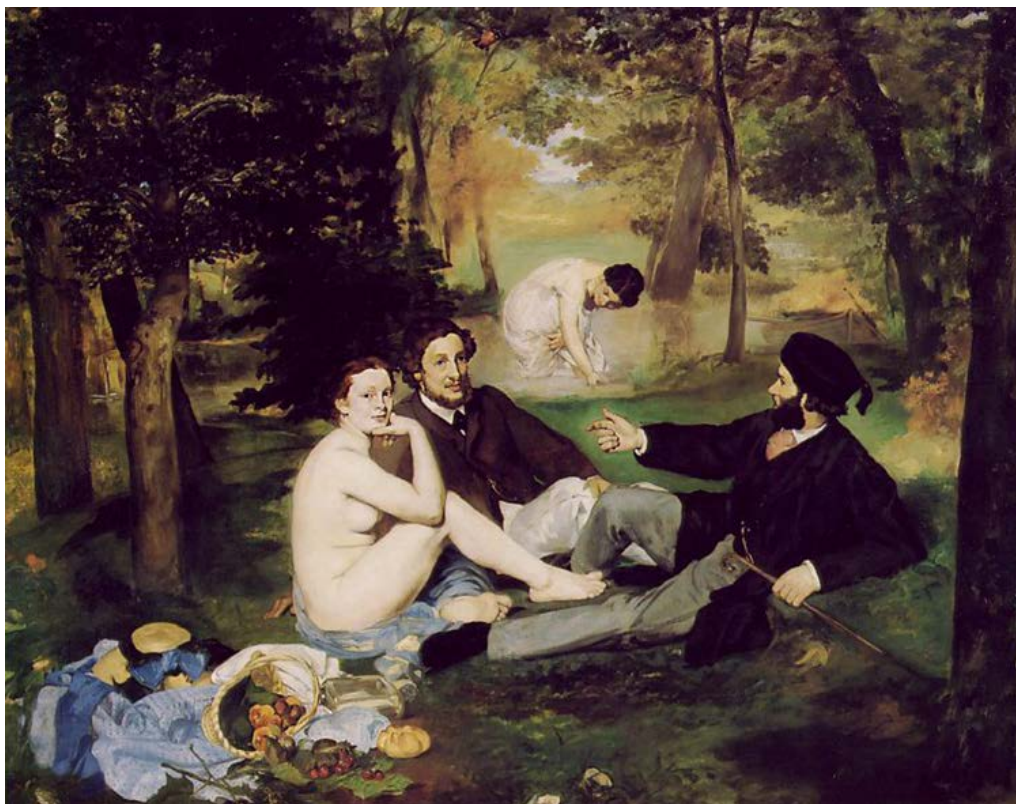
Le déjeuner sur l'herbe , Édouard Manet (1863)

Tal pretensión se consumaría en obras de Manet como el célebre Desayuno sobre la hierba ( Le déjeuner sur l'herbe , 1863, París, Musée d'Orsay), mediante recursos plásticos como figuras fuertemente recortadas contra el fondo, como si estuvieran impresas sobre él, contrastes entre áreas de color poco matizadas, o la ambigüedad de la ubicación espacial; recursos que asimismo enturbian toda posible relación dramática entre las figuras 23 .