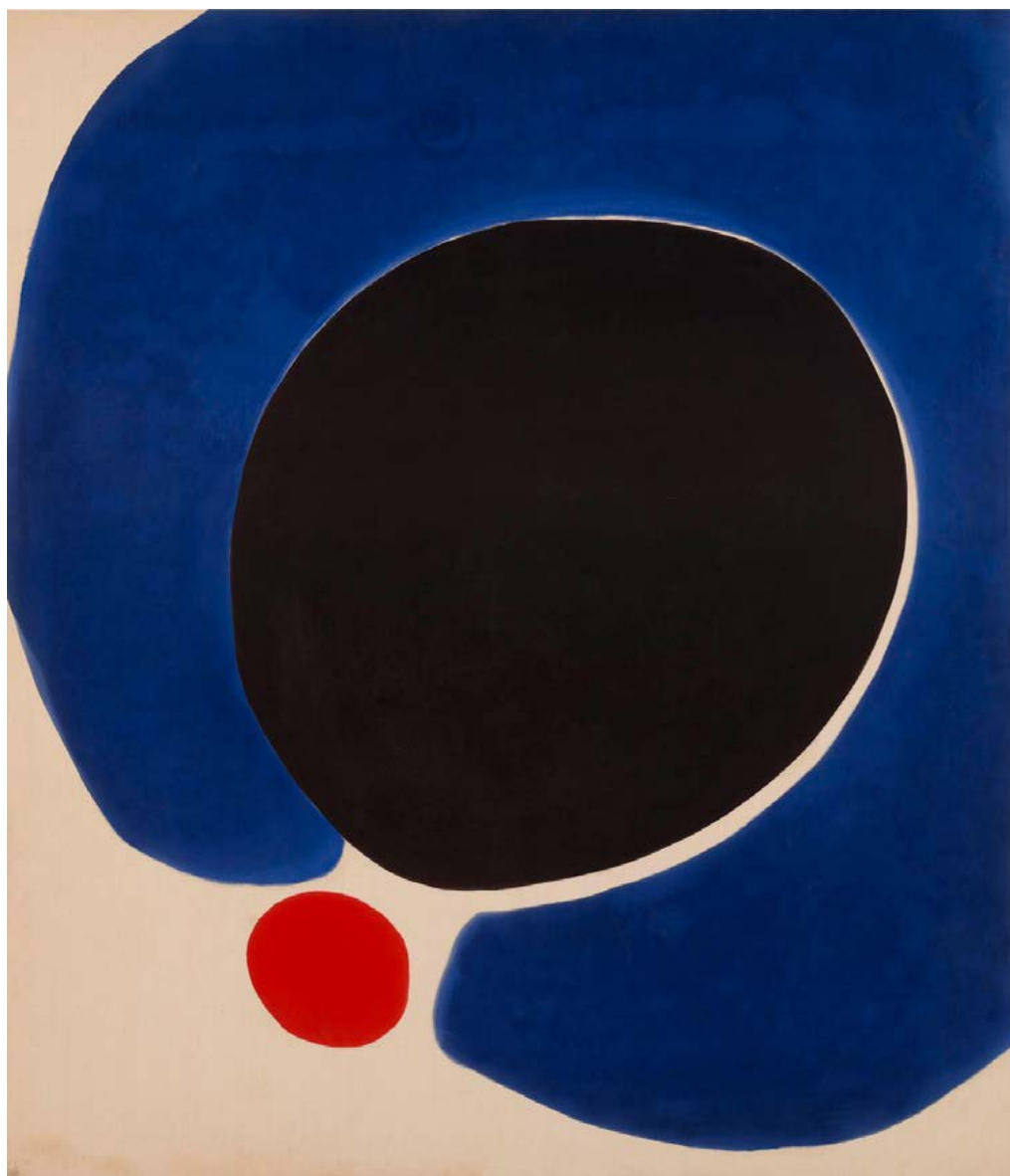
Cleopatra Flesh , Jules Olitski (1962)

Esa «temporalidad puramente visual» permitiría comparar las obras de artistas como Olitski con «la música, el arte del tiempo par excellence » (Fried, Art and objecthood , 247, cursivas en el original). Pero, según Fried, a diferencia de lo que ocurre en caso de la música (donde siempre habría una relación entre duración real de la ejecución de la obra y temporalidad vivida de su escucha), aquí se trataría de un tiempo puramente fenomenológico, enteramente diverso de la duración real del acto de contemplación de la obra, del mismo modo que el «espacio óptico» del que hablaba Greenberg sería inconmensurable con el espacio físico tridimensional de la realidad.