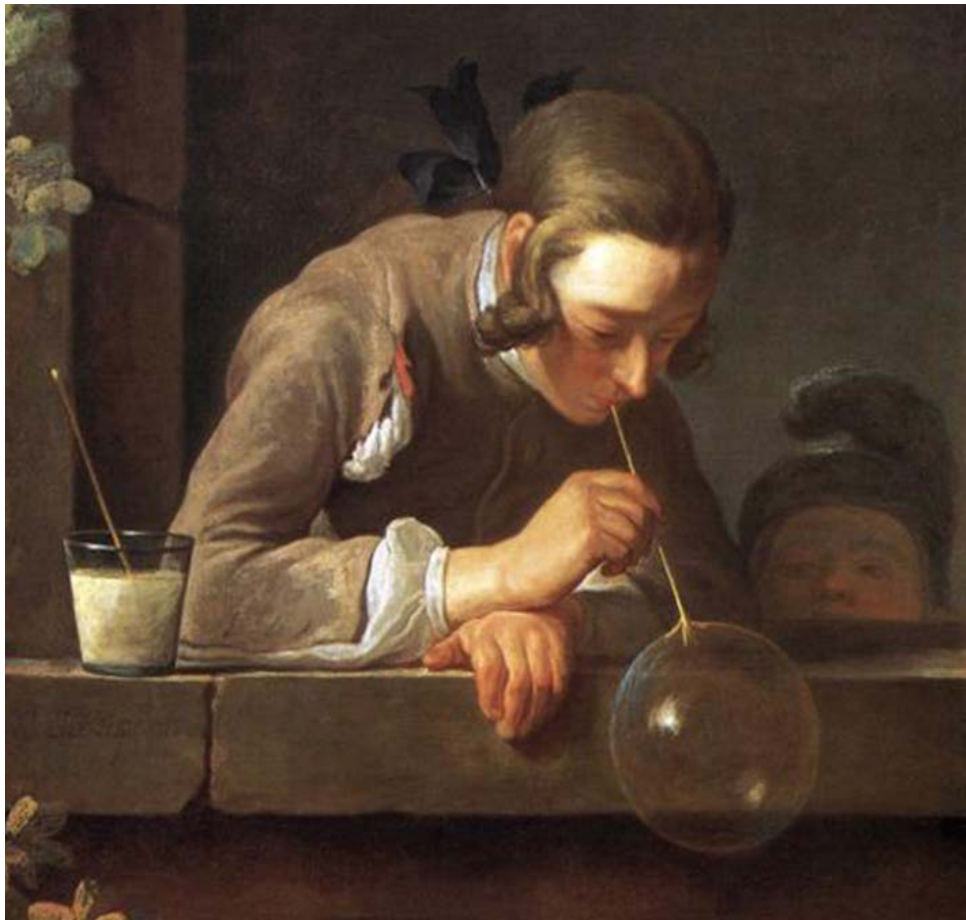
Soap Bubbles , Jean-Baptiste-Siméon Chardin (1739)

A la modalidad temporal instantánea, en cambio, le corresponderían temas dramáticos. En ellos, el evento o acción representado no es repetitivo y tendrá un curso más diferenciado y jerarquizado; implicará a varios personajes, cuyos gestos, actitudes y posiciones cambian rápidamente a lo largo de su desarrollo, de modo que el instante representado no podrá aludir a todos los demás instantes por simple «reiteración», sino que dará la sensación de ser un único instante concreto. Jacques-Louis David y algunos de sus coetáneos de la época heroica y revolucionaria del arte francés habrían destacado en esa modalidad «dramática». Sin embargo, la representación pictórica dramática, como Fried señala mediante un representativo ejemplo, nunca puede ser puramente instantánea: