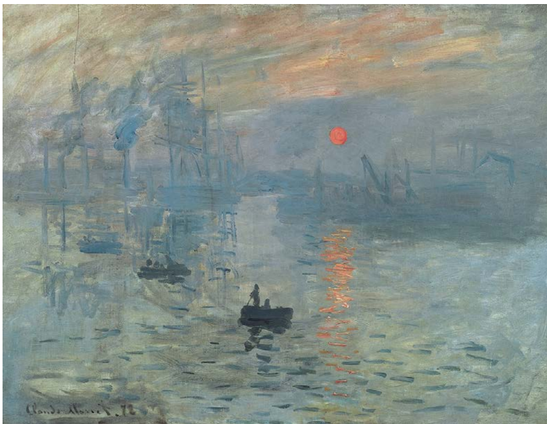
Impression soleil levant , Claude Monet (1872)

con dos atributos profesionales característicos: un ojo rápido y una mano tan ágil como su ojo (Fried, Manet's modernism , 301, 397). Ello habría dado pie a las teorías formalistas de la pintura (reduccionistas y simplificadoras) como el arte «puramente visual», que excluye tiempo y narración y que se desentiende del contenido representativo, y a la interpretación de todo el arte moderno en esos términos por teóricos del siglo XX como Roger Fry o Greenberg, la cual estaría ya anticipada en la equívoca recepción de Manet por los críticos del impresionismo (415) 28 .