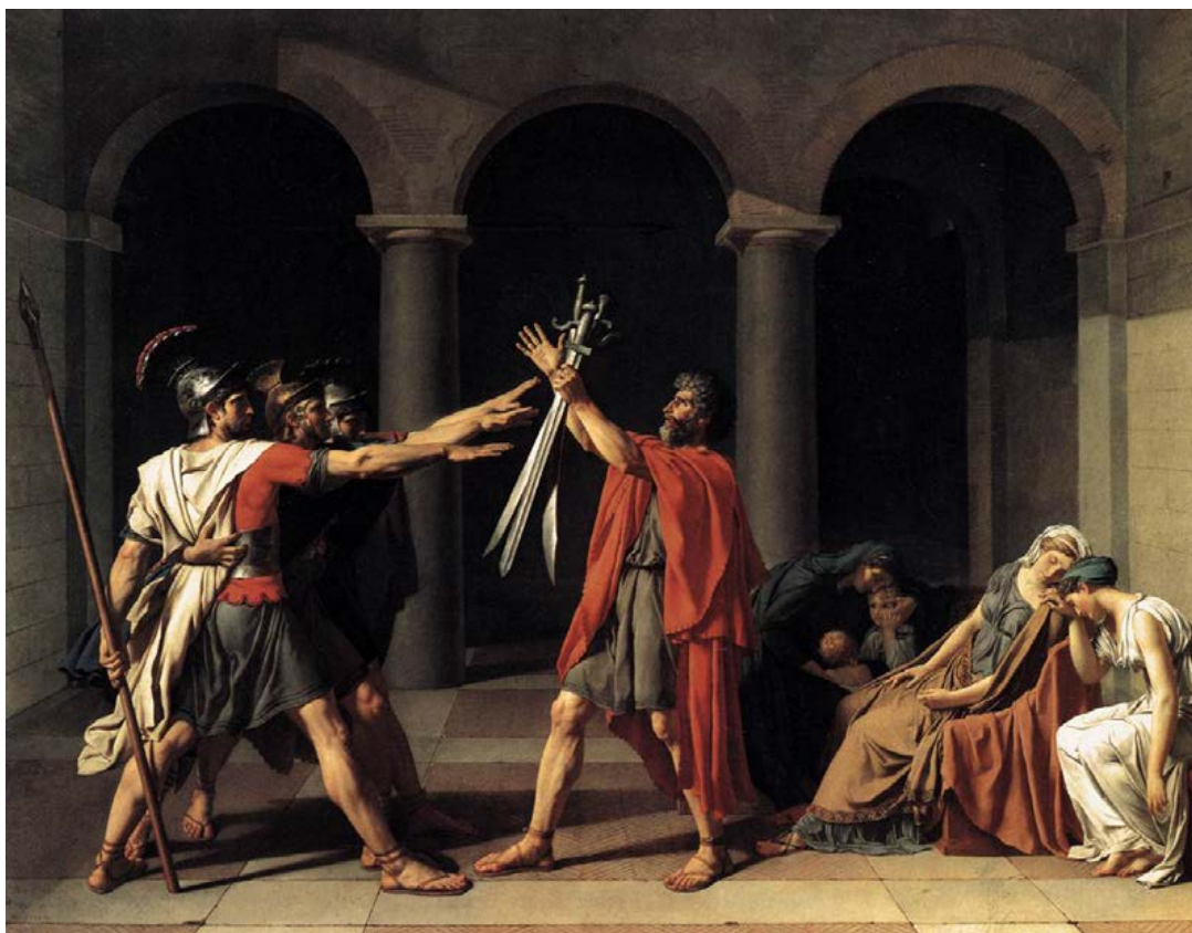
Oath of the Horatii , Jacques-Louis David (1784)

Dado que toda acción requiere un mínimo de duración, la representación pictórica dramática emplea el criterio del «momento pregnante», que formuló Lessing, pero que Fried rastrea también en varios teóricos «antiteatrales» fundacionales ( Absorption and theatricality , 76-92): seleccionar aquel instante perspicuo dentro del curso de acción que sea más significativo emotivamente e inteligible dramáticamente que todos los demás, ofreciendo una sinopsis completa de la acción, al sugerir todas las fases de su desarrollo que no se representan 18 .