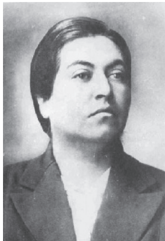
Figura 3. Gabriela Mistral, 1922. Archivo del escritor - Memoria Chilena. (portada del libro de Licia Fiol-Matta, "A queer mother for the nation").

“reprimida”, “frígida”, “hispersexualizada” o lesbiana. Efectivamente, estas mujeres parecen “raras” desde cualquier punto de vista. De ahí que Fiol-Matta se pregunte: ¿por qué el Estado chileno habría elegido a una mujer “lesbiana” como guardiana de “la familia nacional”? En efecto, el éxito de Mistral como encarnación del proyecto nacionalista podría parecer extraño si consideramos su significativa distancia con la conducta y apariencia femenina aceptables en la época.