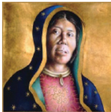
Figura 2. Retablo de la virgen indígena . Michael Walker, 1995.

Junto a la no-problematización de un imaginario del mestizaje cuyo locus de enunciación paradigmático es el del hijo varón, pienso que la reivindicación de Montecino de este empoderamiento de la figura marianista nos pone frente a algunas de las paradojas clásicas del feminismo, que giran en torno a la reapropiación del estigma como estrategia de autoafirmación. Al respecto, lo que Eleni Varikas (2007) ha denominado estrategia de inversión es una clave de lectura importante.