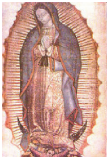
Figura 1. Virgen de Guadalupe . Grabado Siglo XVI. Nueva Basílica de Tepeyac, México.