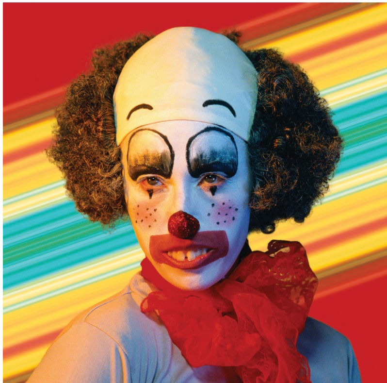
Cindy Sherman, Untitled , 2004.