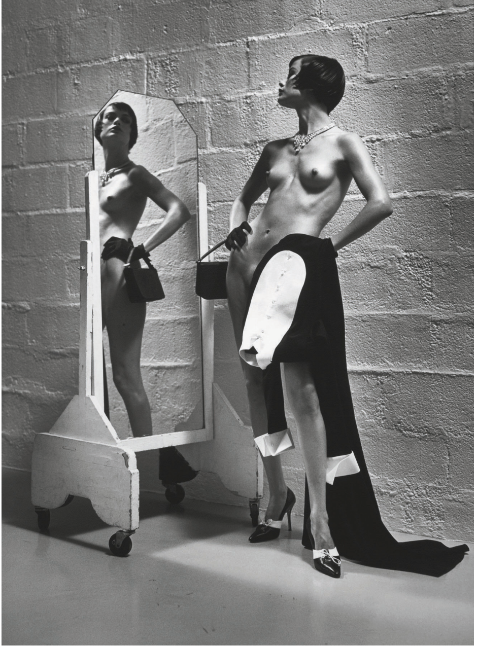
Helmut Newton, Untitled , 1996.