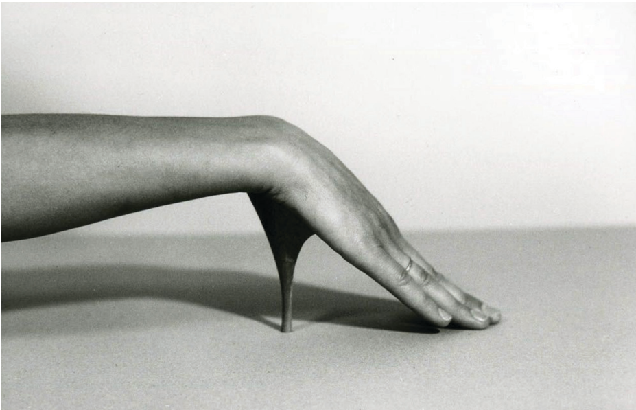
Birgit Jürgensen, Untitled , 1976.