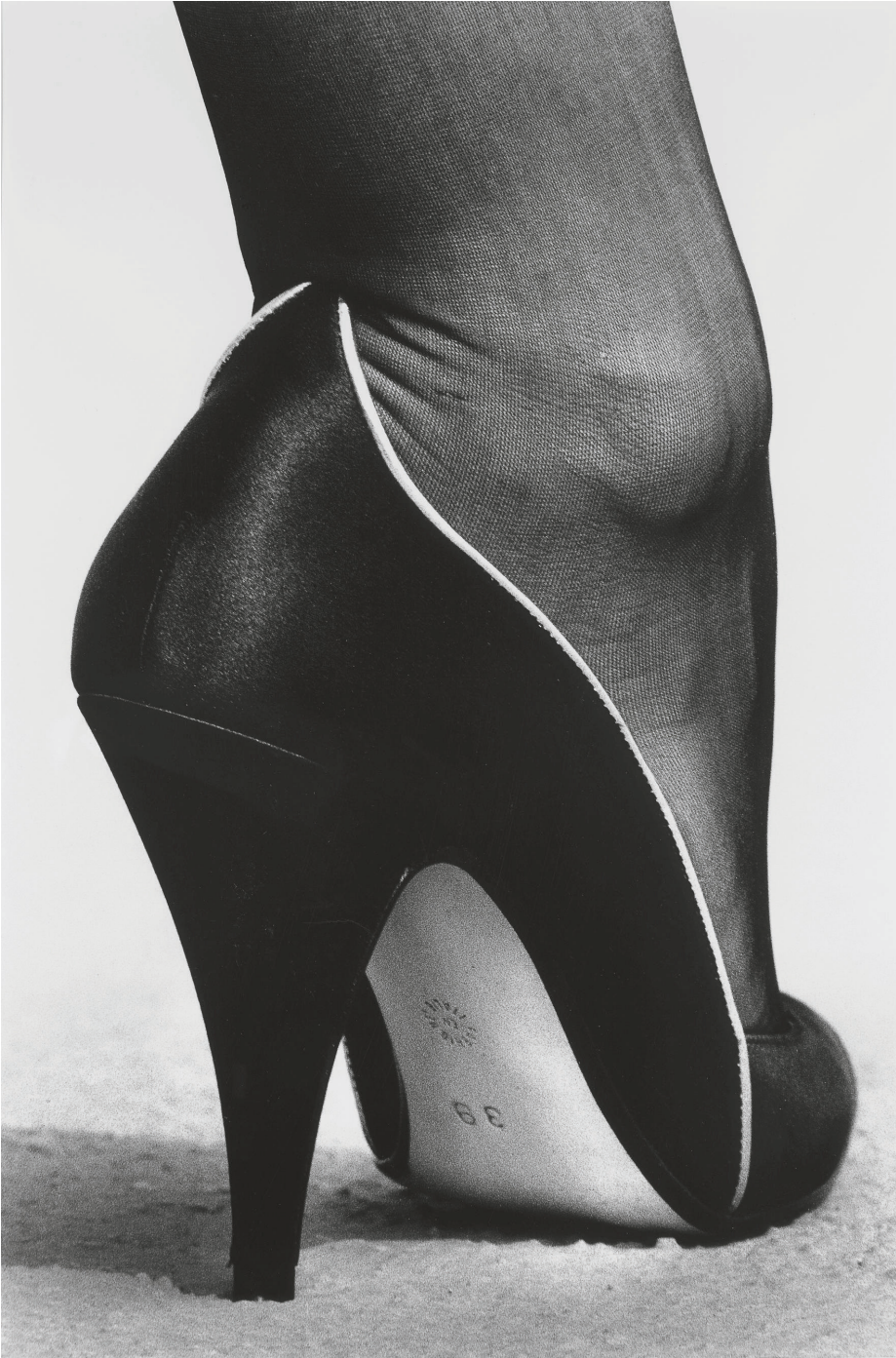
Helmut Newton, Shoe, Monte Carlo , 1983.