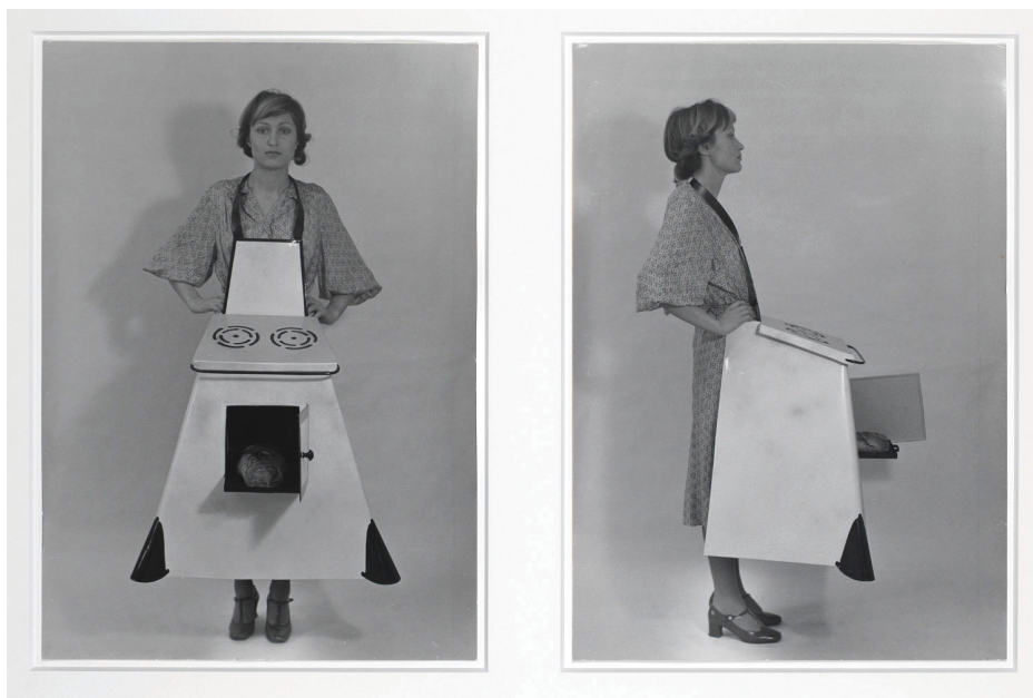
Birgit Jürgenssen, Delantal de cocina , 1975.

un preso o un enfermo, en cualquier caso, de un sujeto obligado a permanecer frente a la lente con el falso gesto de no estar posando.